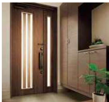
リフォーム玄関ドア リシェント

ピッキングやこじ開け、ガラス破り対策をした防犯対策が標準装備。電気錠タイプならカギの閉め忘れも予防できます。壁を壊さない簡単リフォーム。断熱仕様なら補助金対象に。