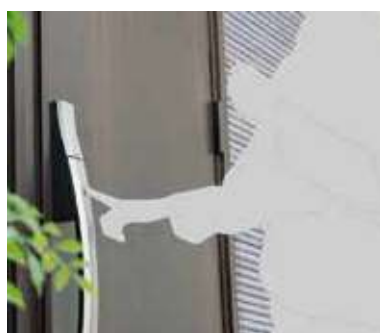
スマートロックシステムFamiLock

FamiLock ならカギを出す手間もなく、ラクラク施錠。ボタンを押してカードをかざすタイプやスマートフォンやリモコンでピッと開けられるタイプなど選べます。