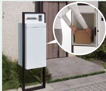
宅配ボックス スマート宅配ポスト

宅配ボックス・ポスト・サイン・インターホンの機能がコンパクトにまとまったオールインワンタイプ。敷地の狭い住宅にもぴったりで、複数荷受も可能。