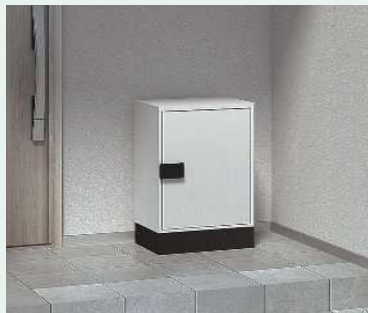
宅配ボックス 宅配ボックスKT

シンプルデザイン・簡単操作の宅配ボックス。スペースに合わせて据置仕様、荷物を取り出しやすいポール仕様から選べます。用途に合わせて2サイズをご用意。